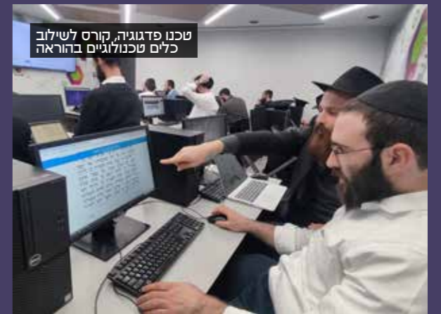
טכנו פדגוגיה, קורס לשילוב כלים טכנולוגיים בהוראה