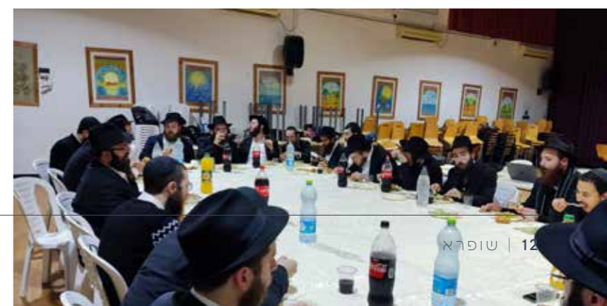
התועודות לשלוחי החינוך המתקיימות תדיר במסגרת תוכניות ההכשרה