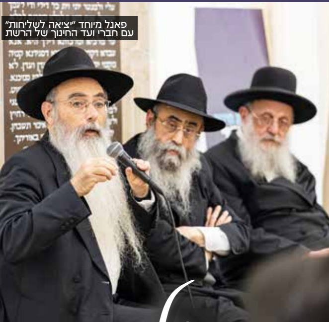
פאנל מיוחד "יציאה לשליחות" עם חברי ועד החינוך של הרשת