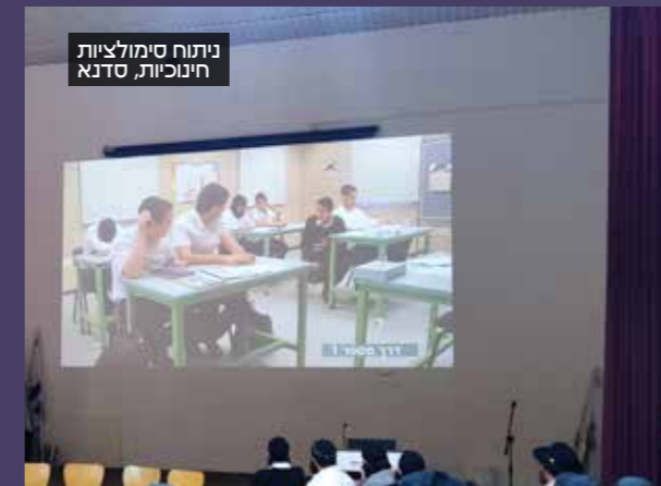
ניתוח סימולציות חינוכיות, סדנא