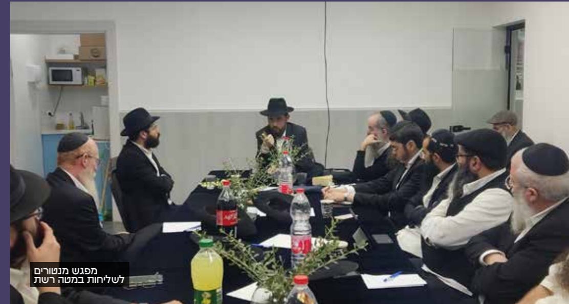
מפגש מנטורים לשליחות במטה רשת