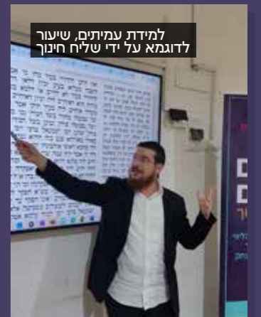
למידת עמיתים, שיעור לדוגמא על ידי שליח חינוך