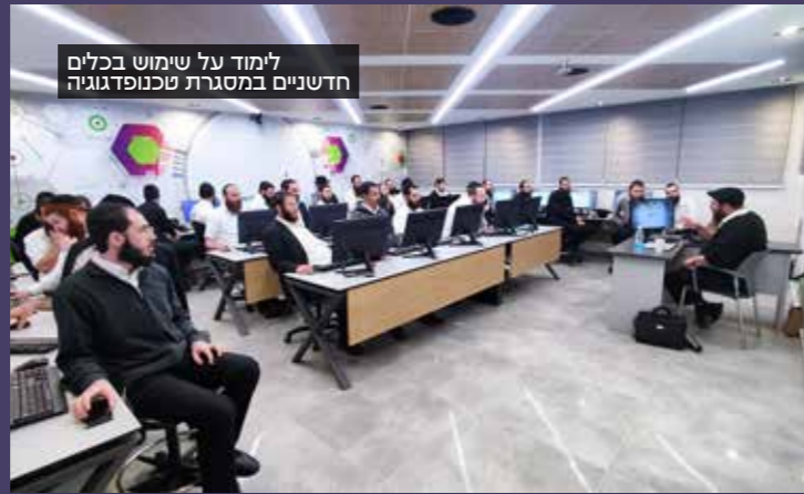
לימוד על שימוש בכלים חדשניים במסגרת טכנופדגוגיה